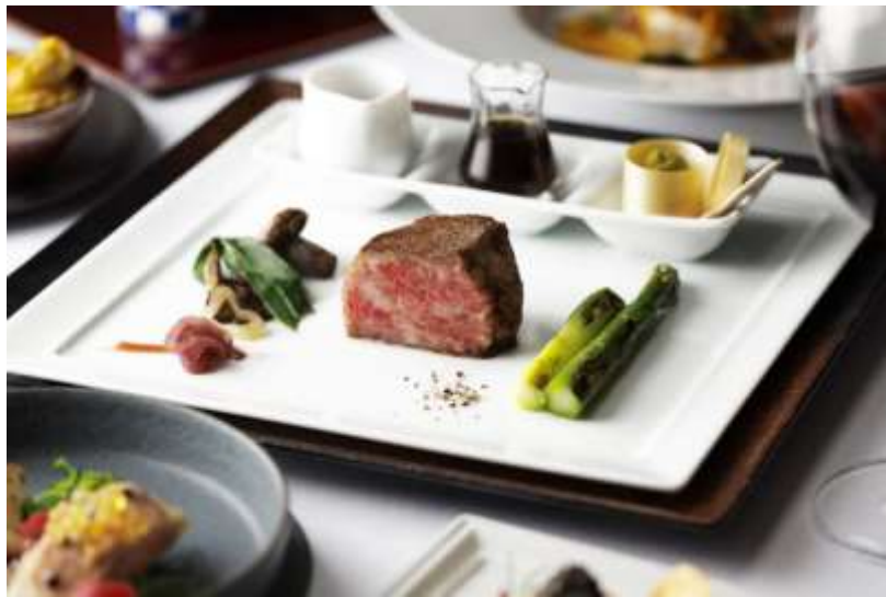
ブラン ルージュ お料理イメージ

東京駅丸の内駅舎の中に位置する東京ステーションホテル（所在地：東京都千代田区丸の内 1-9-1）は、メインダイニングのブラン ルージュならびにバー&カフェ カメリアの2店舗にて1月29日（月）より、宮崎県江田畜産から取り寄せた無添加宮崎牛をつかったメニューを提供します。