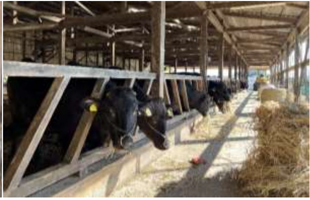
米麴や大豆を給餌することでタンパク質やビタミンなどの栄養素も補給