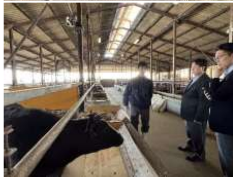
視察の様子、（上）後ろに広がるのは自社栽培の畑