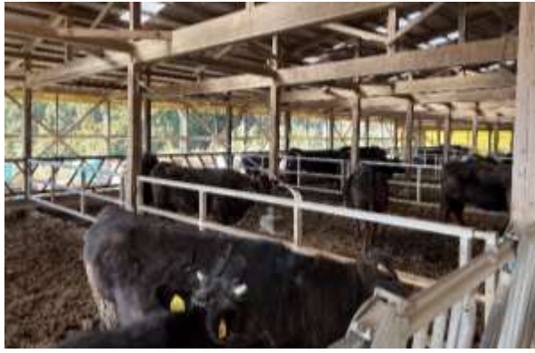
清潔な牛舎、牛たちはのびのびと過ごしている