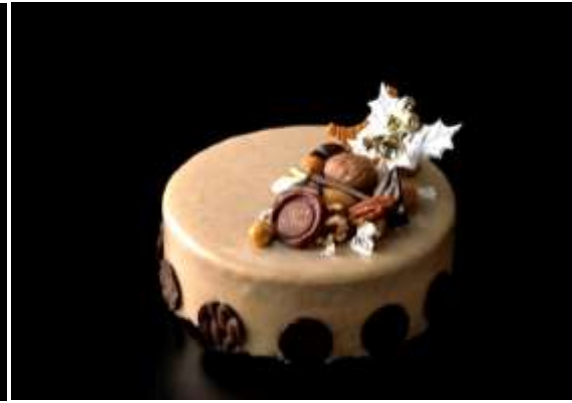
セレンディピティ ～栗と紅茶のショコラムース～ イメージ