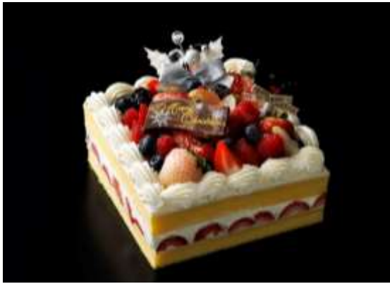
プレミアムショートケーキ イメージ