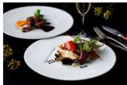
「レストラン ブラン ルージュ」ノエル イメージ