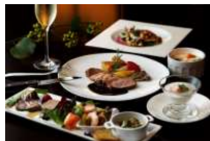
「バー&カフェ カメリア」トウインクルクリスマス イメージ

乾杯のシャンパーニュが付いた全 6 品のコースをご用意しました。オードブル盛り合わせではスモークサーモンや蝦夷鮑のブルゴーニュ風など、バーならではのお酒にあうお料理を揃えました。心もほっと温まる滋味深い七面鳥スープのあとには、お魚料理やお肉料理もつづく充実のフルコースです。お好みのお酒とのペアリングもお楽しみください。