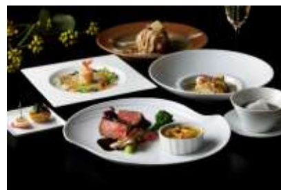
「アトリウム」ペントハウス クリスマスディナー イメージ

本格派アーティストの華麗なパフォーマンスとフルコースをご堪能いただく 3 夜限定のライブ & ディナー。12 月 23 日のアーティストは現代日本のジャズシーンを牽引する Jazz トリオ NAMIHEY が Jazz Soul R & B の名曲やクリスマスソングをお届け。12 月 24、25 日に登場の「Saasha & Little Sweet Child」はクリスマスの名曲を特別アレンジで披露します。ライブとともに楽しみいただくお料理は、キャビアとスモークしたソイクリーム、クエの自家製スモークと甘海老のタルタル ライム風味や石川県輪島直送甘鯛のポワレ、黒毛和牛ロースのグリエなど全 6 品。静寂な空間に響く軽やかな歌声に酔いしれながら、優雅なひとときをお過ごしください。