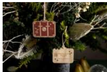
クリスマスチャリティーオーナメント イメージ

「Share the Joy of Christmas - 共に喜びを分かちあうひとときを」というコンセプトに基づく2015年から続くチャリティーオーナメントの販売は、私達を取り巻く自然環境にも意識を向けいただくきっかけになればとSDGs活動の一環としてお気軽にご参加いただける取り組みです。今年も森林保全団体のmore trees(モア・トゥリーズ)とコラボレーションして製作しました。