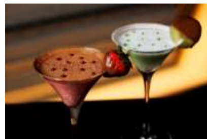
クリスマスカクテル イメージ

バックバーのロゴ「STATION HOTEL」がさりげなく歴史を物語るカメラアにて、クリスマスカラーが楽しいデザート感覚のクリーミカクテルをご用意。アレキサンダーをベースに瑞々しいいちごやキウイのフルーツ感をプラスして飲みやすく、口当たりまるやかにアレンジしました。時を忘れてゆっくりと食後の時間をお過ごしいただく、ダイジェスティフにぴったりのカクテルです。