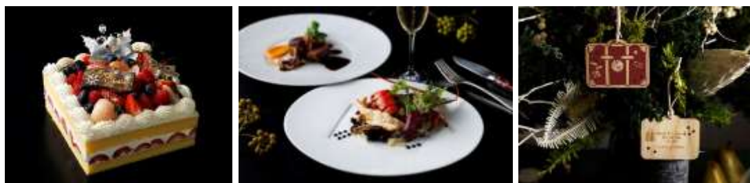
2023年クリスマスイメージ

東京駅丸の内駅舎の中に位置する東京ステーションホテル（所在地：東京都千代田区丸の内 1-9-1）では、新作を含むクリスマスケーキや聖なる夜を優雅に祝うディナー、ハイティー、毎年恒例のオリジナルチャリティーオーナメントなど、様々なシチュエーションで 2023 年のフェスティブシーズンを彩り豊かに演出します。街が眩き心躍るクリスマス、大切な人と喜びを分かちあう、心が温まるひとときをお過ごしください。