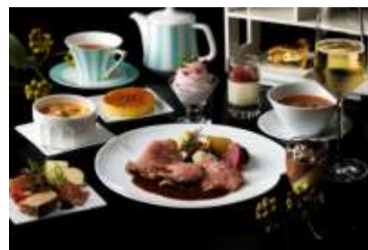
クリスマスハイティー イメージ

ヴェネチアンシャンデリアがエレガントに煌めくロビーラウンジでは、ティースタンドをホワイトツリーに見立てたクリスマス限定のスペシャルメニューをご用意しました。チョコレートのムースや苺のティラミスなど4種のスイーツと、トリュフが香るキッシュや鮑、海老、帆立貝のココットグラタンなど高級食材をつかったセイボリーにくわえ、メインには黒毛和牛サーロインのローストビーフがフェスティブシーズンの特別な夜をお約束します。セイボリーとスイーツのバランスが良く、お食事としても十分ご満足いただけます。