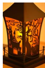
「ハロウィーンデコレーションルーム」イメージ写真 ▲