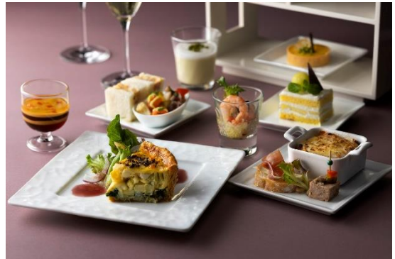
トワイライトハイティー (イメージ)

店舗詳細: https://www.tokystationhotel.jp/restaurants/lobbylounge/