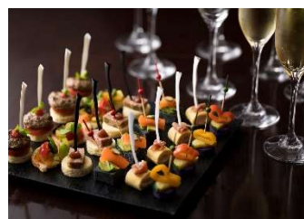
フィンガーフード イメージ