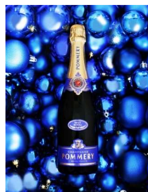
「ポメリー」イメージ

カウントダウンの夜を彩るアーティストは、迫力満点のステージをお届けする女性ビッグバンドの「たをやめオルケスタ」。総勢16名のフルメンバーが登場します。2020年夏のビッグイベントを祝してこのイベントにちなんだ“五輪ミュージック”をダンスブルに奏で、新年を迎える瞬間を最高潮に盛り上げます。