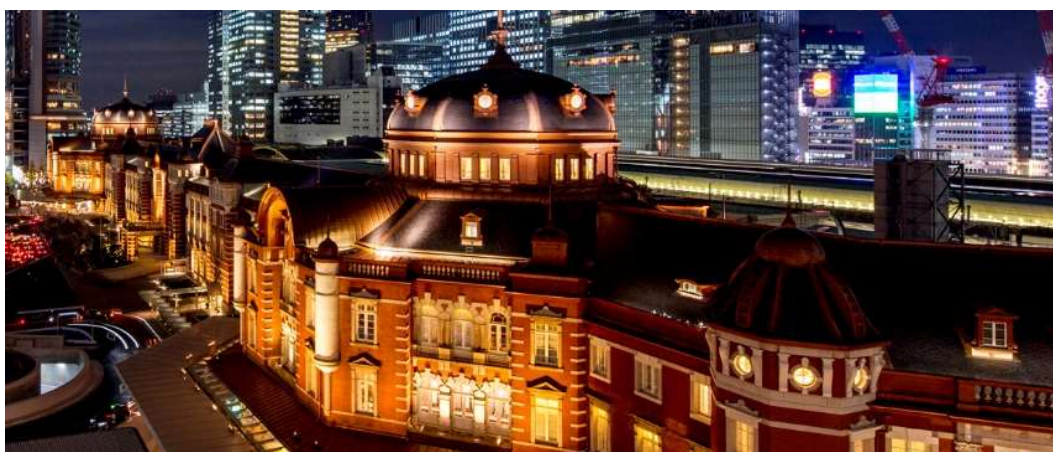
カウントダウン会場となる、東京駅丸の内駅舎

東京駅丸の内駅舎の中に位置する東京ステーションホテル(所在地:東京都千代田区丸の内 1-9-1)は、 毎回事前予約で定員に達するほど人気の高い、バー&カフェ<カメリア>の「TSH COUNTDOWN Party」を今年も開催いたします。 本日、2019年11月18日(月)の10:30頃に特設ウェブサイトを公開し、同時にご参加申込みの予約受付を開始いたします(1名様 12,000円/税サ込)。