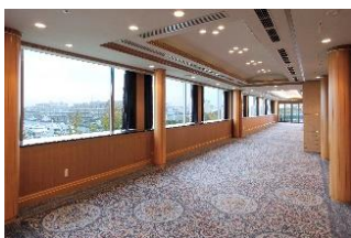
本館 5 階スターライトルーム

宴会プランのご予約・お問合せ 宴会予約課 045-681-1841(代表) 10:30~18:30