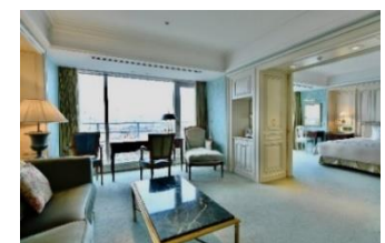
タワー館ブルミエスイート

宿泊プランのご予約・お問合せ 宿泊予約課 045-681-1841(代表) 9:00~19:00