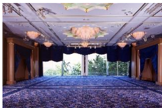
タワー館 3 階ベリー来航の間