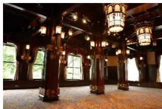
本館 2 階フェニックスルーム