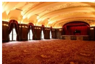
本館 2 階レインボーボールルーム