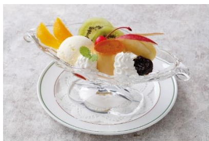
プリン・ア・ラ・モード + ¥1,265(税サ込) 年代問わず愛され続ける ホテルニューグランド発祥デザートです。