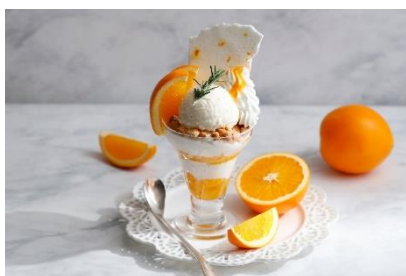
清見オレンジのパフェ + ¥1,644(税サ込) 豊かな果汁と爽やかな香りが魅力の 春限定パフェです。