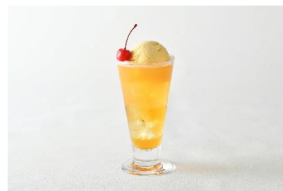
大人のクリームソーダ + ¥450(税サ込) 北海道産赤肉メロンの完熟した旨味たっぷりの シロップを贅沢に使用したリッチな味わい。