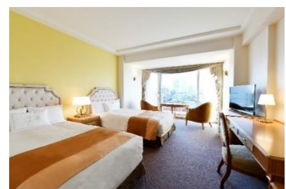
▲タワー館 グランドクラブフロア ツイン