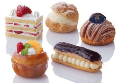
ショートケーキ シューアラクレーム モンブラン サヴァラン エクレール

オレンジの爽やかな甘さと口当たりの良いカスタードを合わせた色鮮やかなタルトです。