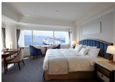
▲タワー館 スーペリアフロア ベイフロントコーナーダブル

“横浜時間”をコンセプトにした横浜港を一望できる多彩なお部屋からお選びいただけます。