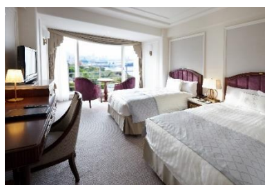
▲タワー館 スーペリアフロア ベイサイドツイン