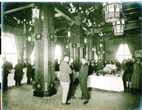
▲1927 年開業時の頃のフェニックスルーム