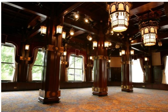
▲本館 2 階フェニックスルーム

1927 年(昭和 2 年)ホテルニューグランド開業時はメインダイニングとして営業をしていたフェニックスルームは、桃山調と呼ばれる日本風の様式で、当時のお客様のほとんどが外国人であったことを意識しての造りです。今も変わらず宴会場として使用されており、一歩足を踏み入ると天井の装飾や独特な雰囲気魅了される日本古来の神殿を内包したかのような魅力のある会場です。