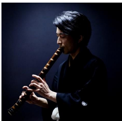
田中黎山(尺八演奏家)