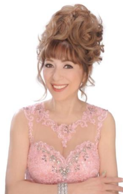
キャロル山崎(ジャズボーカリスト)