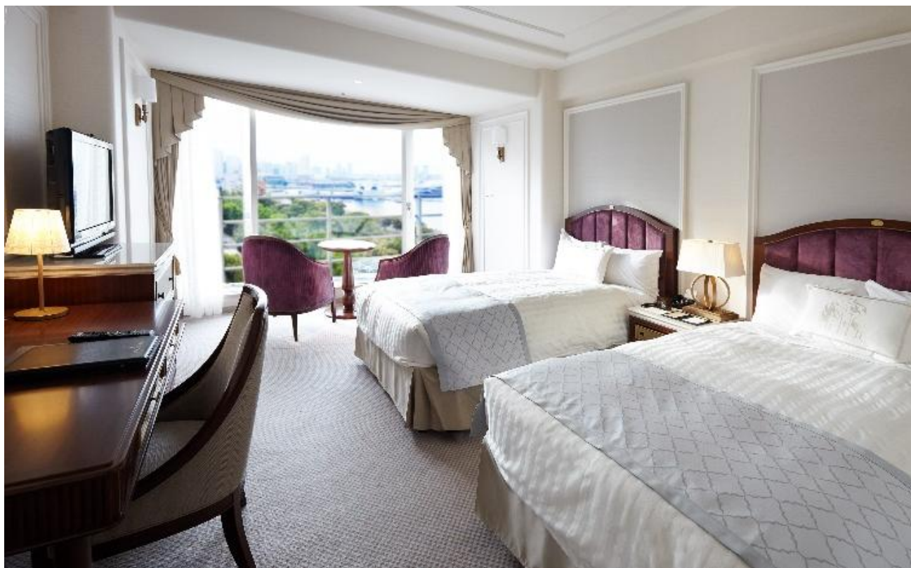
▲タワー館スーペリアフロア ベイサイドツイン

横浜港を一望できるタワー館のお部屋にご滞在いただけます。 昼は澄み渡るような海と空、日没には美しい夕焼けを、夜は宝石を散りばめたような煌めく夜景と 変化する横浜の風景を絵画のようにご覧いただけます。 2026年が良きスタートとなるよう、身も心も晴れやかな気持ちでお寛ぎいただける時間をお楽しみください。