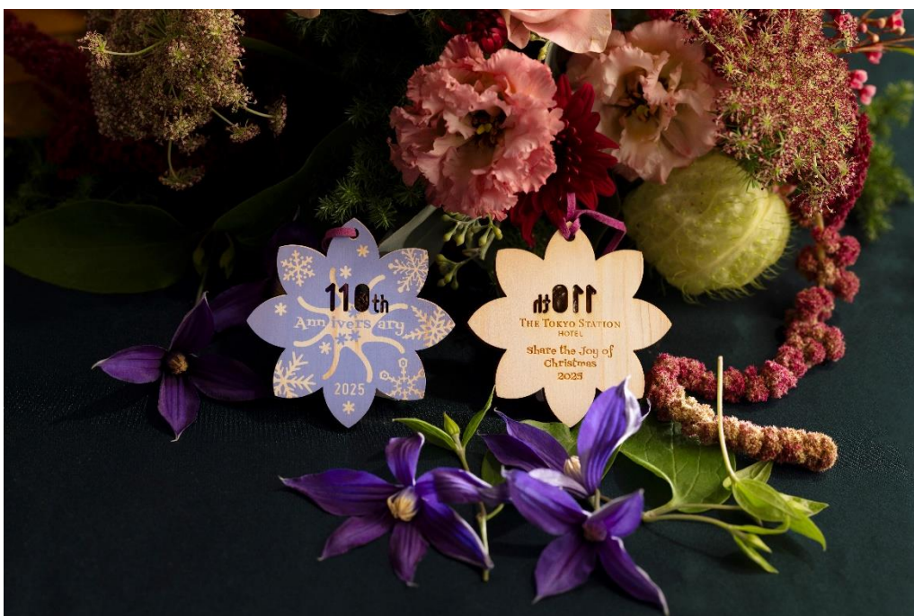
クリスマスチャリティーオーナメント 2025

今年、開業 110 周年を迎えた東京ステーションホテル（所在地：東京都千代田区丸の内 1-9-1）では、毎年恒例のクリスマスチャリティーオーナメントを、今年も森林保全団体の more trees（モア・トゥリーズ）にご協力いただき製作。募った寄付金全額を more trees の森林保全活動に役立てていただきます。今年のオーナメントは、ホテルが位置する東京駅丸の内駅舎のドーム天井や、1F メインロビーにもあしらわれている、東京ステーションホテルにとって縁の深い花〈クレマチス〉をモチーフに、〈110 th 〉の数字をくり抜き、110 周年の節目にふさわしいデザインをご用意いたしました。