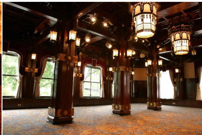
本館 2 階フェニックスルーム