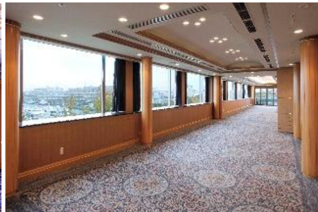
本館 5 階スターライトルーム

宴会プランのご予約・お問合せ 宴会予約課 045-681-1841（代表） 10:30～18:30