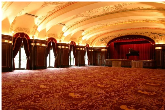
本館 2 階レインボーボールルーム