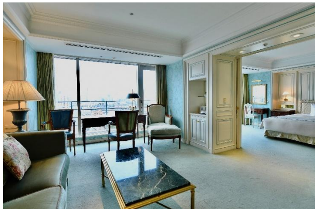
タワー館ブルミエスイート ダブル