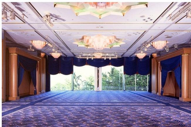
タワー館 3 階ベリー来航の間