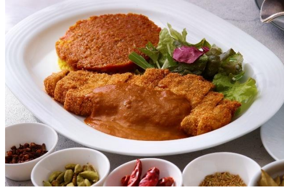
ビーフカツカレー