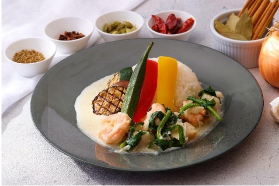
シーフードホワイトカレー