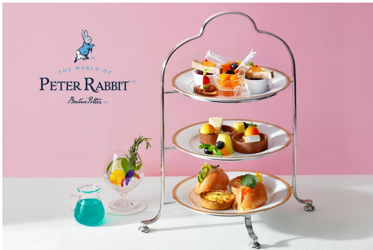
▲画像は 2 名様分のイメージです

ホテルニューグランド(横浜市中区山下町 10 番地/総支配人 木曾博文)では、2026 年 7 月 1 日(水)~8 月 31 日(月)まで、「ピーターラビット™のドレスティ・アペロ」を販売します。夕食前に軽くお酒を楽しむ習慣の“アペロ”から着想を得て、平日の夜 17:00 以降にご提供している「ドレスティ・アペロ」。この度、ピーターラビット™の作者ビアトリクス・ポター™生誕 160 周年を記念したドレスティ・アペロを期間限定でご提供します。「ラディッシュと香草バター」や「サーモンリエットのサンドウィッチ」、「たまねぎとベーコンのキッシュ ラベンダーの香り」など、絵本に登場する様々なエピソードを各種セイボリーで表現しました。今もなお世界中で愛され、多くの人々を魅了し続けるピーターラビット™の世界を存分にご堪能いただけるドレスティ・アペロを、ぜひお楽しみください。