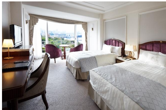
タワー館スーペリアフロア ベイサイドツイン

横浜市認定歴史的建造物である本館など、 ホテル館内を散策しながらの謎解き、ごゆっくりお楽しみください。