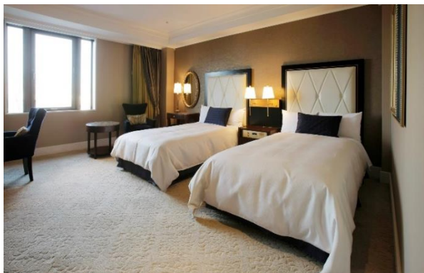
本館デラックスツイン

お部屋タイプは、クラシックな落ち着いた雰囲気の本館デラックスツイン または、横浜港を一望できるタワー館スーペリアフロア ベイサイドツイン よりお選びいただけます。